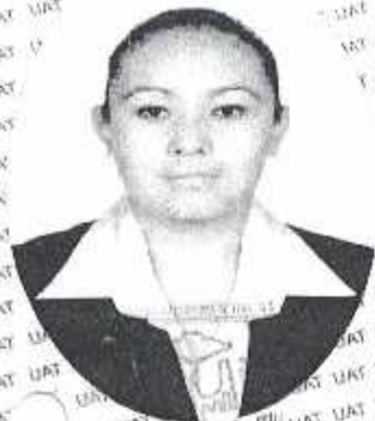
Firma del interesado

"Por la Cultura a la Justicia Social" Dado en la Ciudad de Tlaxcala de Xicohténcatl el 23 de enero de 2009.