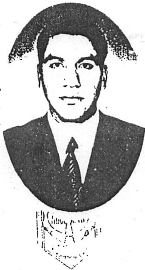
Firma del interesado

"Por la Cultura a la Justicia Social" Dado en la Ciudad de Tlaxcala de Xicohténcatl el 10 de marzo de 2006.