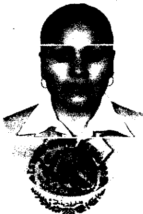
Secretaría de Educación Pública PUEBLA, PUE.

justificó debidamente haber sido aprobada en los exámenes parciales respectivos de todas las materias que la Ley señala para el Grado de Maestría en Ciencias de la Educación, y en el Acto de Recepción de Grado correspondiente sustentado en el Instituto de Estudios Universitarios, A.C. de esta ciudad, el día 26 de febrero de 2015, según consta en los certificados de estudios y acta existentes en el archivo de la Secretaría de Educación Pública, con fundamento en el Artículo 119 de la Constitución Política del Estado, le expide el presente Grado de