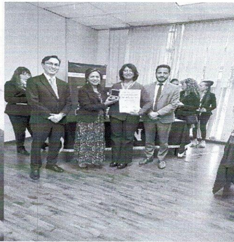
Entrega de preseña del Proceso de Reconocimiento a la Practica Educativa en Educación Media Superior 2023