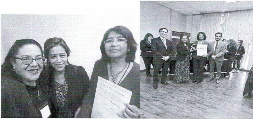
Entrega de preseña del Proceso de Reconocimiento a la Practica Educativa en Educación Media Superior 2023