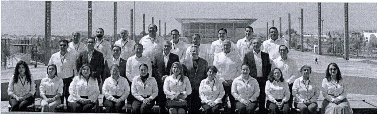
Encuentro Nacional de Academias de los CECyTE 2025

Con estas acciones seguimos sumando esfuerzos para garantizar una educación media superior de calidad, innovación y compromiso con la juventud.