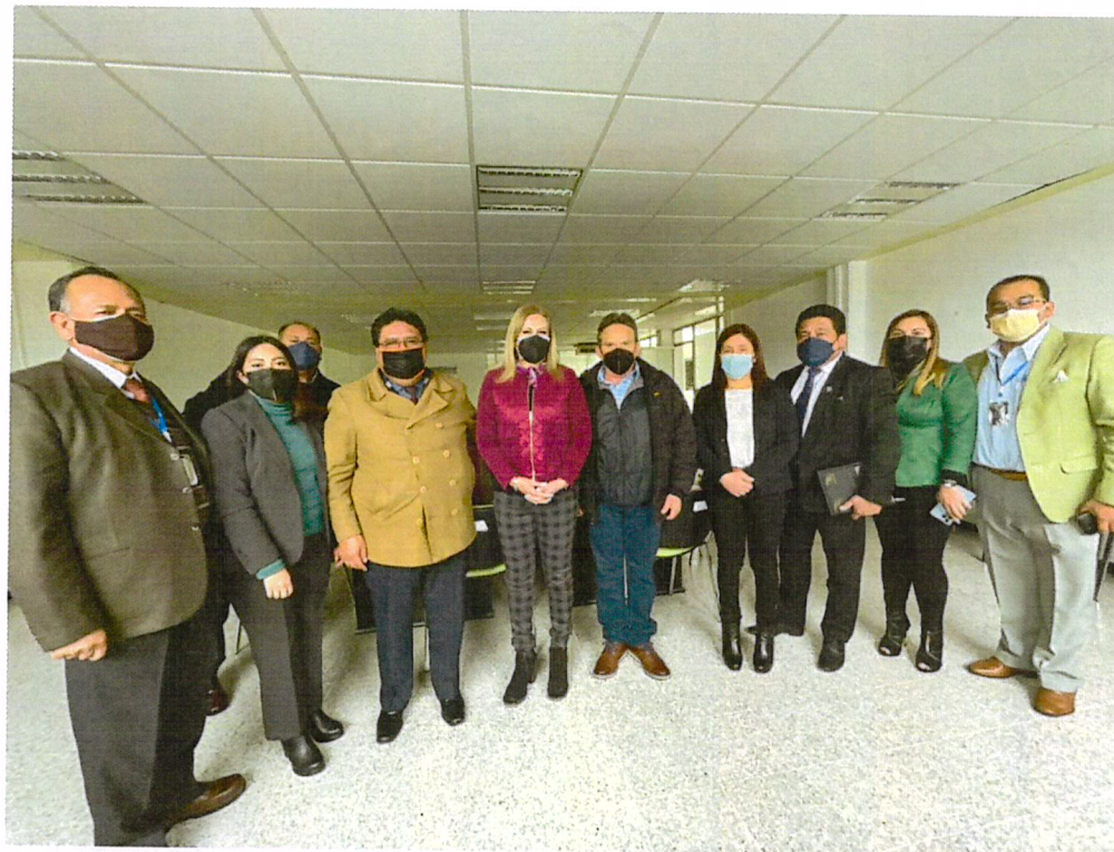
Reunión personal USICAMM, Coordinación Nacional y Dirección General de CECyTE Ciudad de México, 21 de enero de 2022.